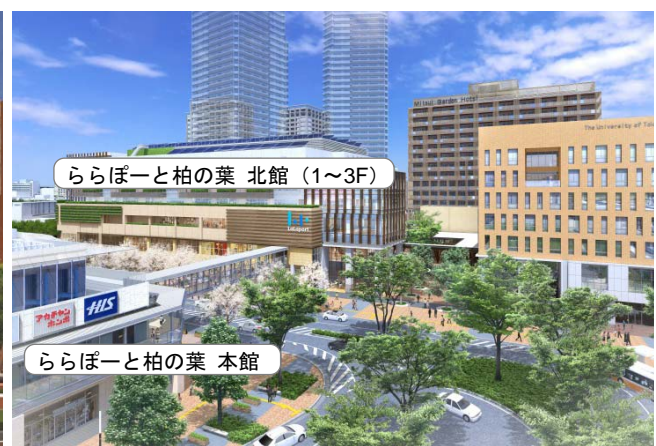
【柏の葉キャンパス駅前 完成予想イメージ】