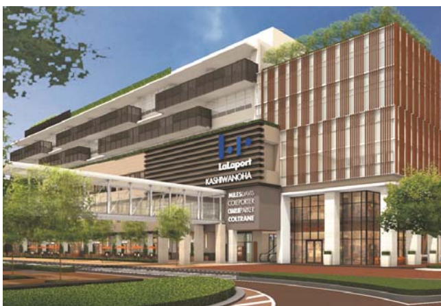
【ららぽーと柏の葉 北館 外観イメージ】